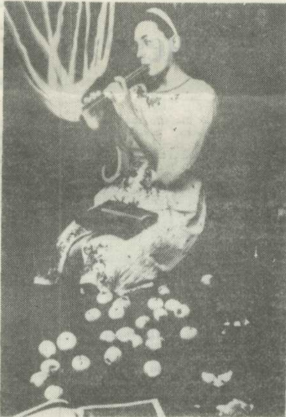
В. Рейм. Игра на флейте.

гостил у родственников. Лева до слез обрадовался тому, что я действительно, как он и предполагал, его сосед по детству.