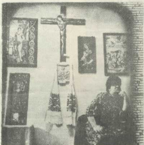
За газетной строкой.